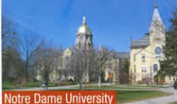
Notre Dame University

De manera muy positiva, todos los estudiantes que preparo han sido aceptados en diferentes prestigiosas universidades americanas.